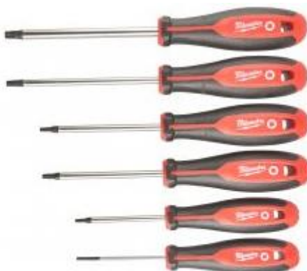
4932471809 Tri- lobe Schroevendraaier Torx set - 6pc