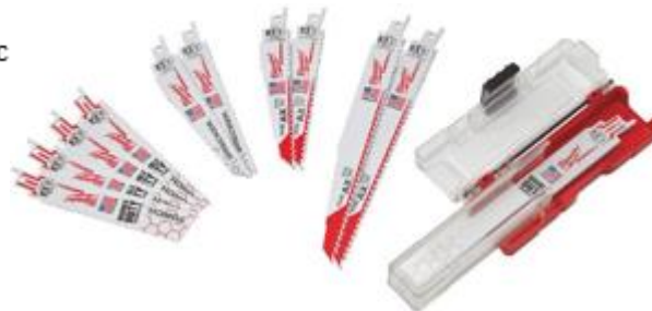
49222229 Zaagbladen set 12 stuks