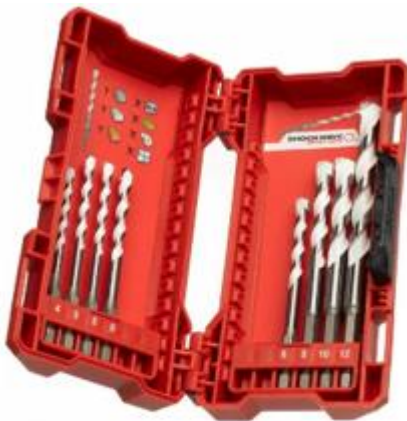
4932471112 Multi materiaalboor 8pc