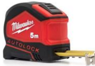
4932464663 Rolmaat autolock 5m x 25mm