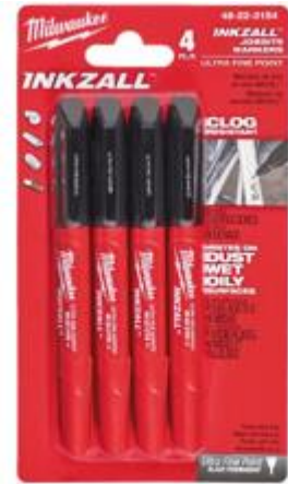
48223154 Inkzall marker met fijne punt