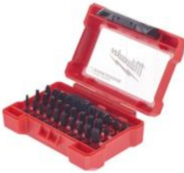
4932464240 Shockwave set 32 st